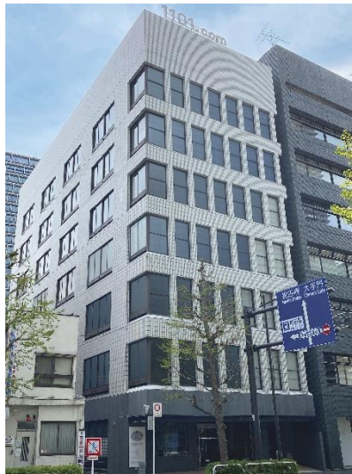
東京都千代田区神田錦町