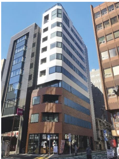
東京都千代田区神田鍛冶町