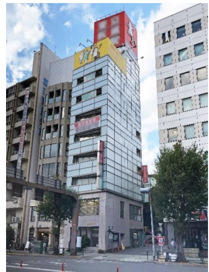
東京都新宿区市谷八幡町